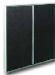
Filtro de carbón