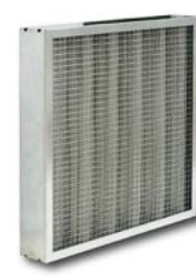
Filtro de malla