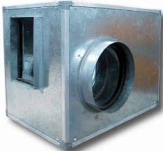
En la imagen: Posición N°1 transmisión izquierda. Asp. derecha Posición estándar: n°1 Montaje no estándar, suplemento del 6%

Caja de ventilación, fabricada en chapa de acero galvanizado con aislamiento de espesor 15 ó 25 mm, ventilador centrífugo baja presión simple oído diseñado para ser accionado por un sistema de poleas-correas, rodete de álabes hacia adelante y montado sobre soportes antivibratorios y el motor sobre bancada o en la parte trasera del ventilador (hasta 2,2 kW).