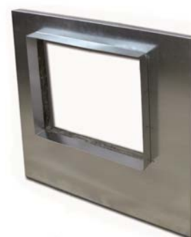
TAPA CON CUELLO