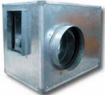
En la imagen: Posición N°1 transmisión izquierda. Asp. derecha Posición estándar: n°1 Montaje no estándar, suplemento del 6%

Caja de ventilación, fabricada en chapa de acero galvanizado con aislamiento de espesor 15 ó 25 mm, ventilador centrífugo baja presión simple oído diseñado para ser accionado por un sistema de poleas-correas, rodete de álabes hacia adelante y montado sobre soportes antivibratorios y el motor sobre bancada o en la parte trasera del ventilador (hasta 2,2 kW).